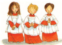
SLUŽITE GOSPODU Z VESELJEM!